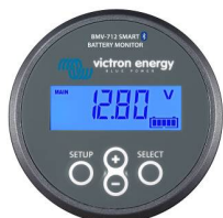
Rilevamento Bluetooth Dispositivo di controllo della batteria Smart BMV-712