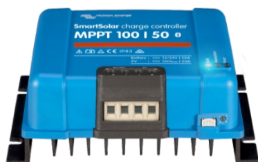
Regolatori di carica SmartSolar MPPT 100/50