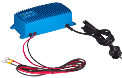
Caricabatterie Blue Smart IP67 12/25