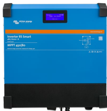
Inverter RS Smart 48/6000