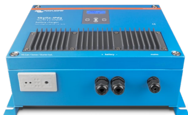
Skylla-IP65 12/70 (1+1)

Per saperne di più sulle batterie e la loro ricarica consultate il nostro manuale "Energia illimitata" (scaricabile gratuitamente dal sito Victron Energy www.victronenergy.com ).