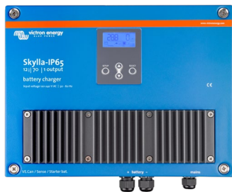
Skylla-IP65 12/70 (1+1)

12 V/70 A e 24 V/35 A, gamma di tensione d'ingresso 90-265 V