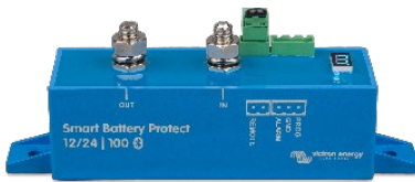
Smart BatteryProtect BP-100