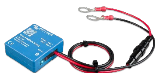
Rilevamento Bluetooth Rilevatore Smart Battery