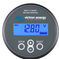
Rilevamento Bluetooth Dispositivo di controllo della batteria Smart BMV-712