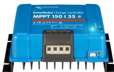
Regolatori di carica SmartSolar MPPT 150/35